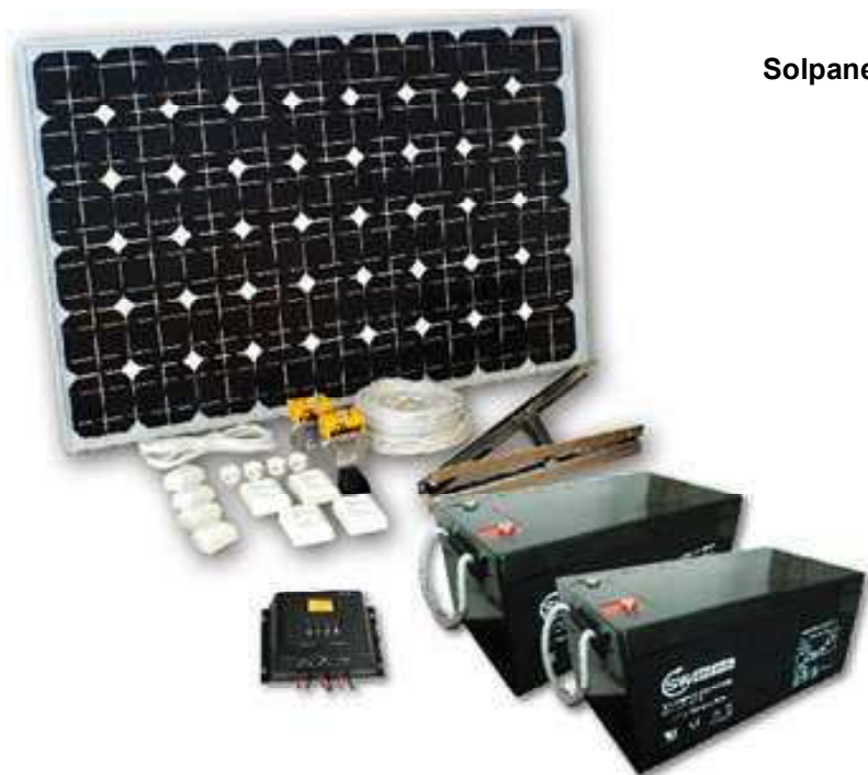
Solpanelspaket SW 160W Basic-paket Art.nr 20-2310

Utgångspunkten är att stugan används från tidig vår till höst, mestadels på helger, under sommaren för längre tidsperioder. Om stugan kommer att användas längre perioder under vinterhalvåret rekommenderar vi att elverk och/eller vindkraftverk kompletterar anläggningen. Paketet är beräknat för att kunna driva ett 12V kylskåp (110 liter) förutom belysning, TV, vattenpump och annan mindre elektrisk utrustning. Med en omformare (ingår ej) kan du också använda andra 230V utrustningar som t.ex. hemelektronik, dammsugare, mikrovågsugn etc.